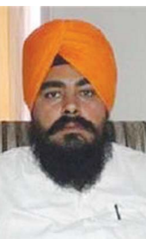
ਗੱਡੀ ਉਨ੍ਹਾਂ ਦੇ ਸਹੁਰੇ ਨੇ ਇਸਤੇਮਾਲ ਕਰਨ ਲਈ ਦਿੱਤੀ ਸੀ। ਉਨ੍ਹਾਂ ਨੇ ਕਦੇ ਵੀ ਸਹੁਰੇ ਦੀ ਆਮਦਨ ਦੇ ਸਰੋਤ ਬਾਰੇ ਨਹੀਂ ਪੁੱਛਿਆ। ਉਨ੍ਹਾਂ ਦੇ ਸਹੁਰੇ ਪਰਿਵਾਰ ਨੇ ਪਹਿਲਾਂ ਵੀ ਕਾਰੋਬਾਰ ਸਥਾਪਤ ਕਰਨ 'ਚ ਉਨ੍ਹਾਂ ਦੀ ਮਦਦ