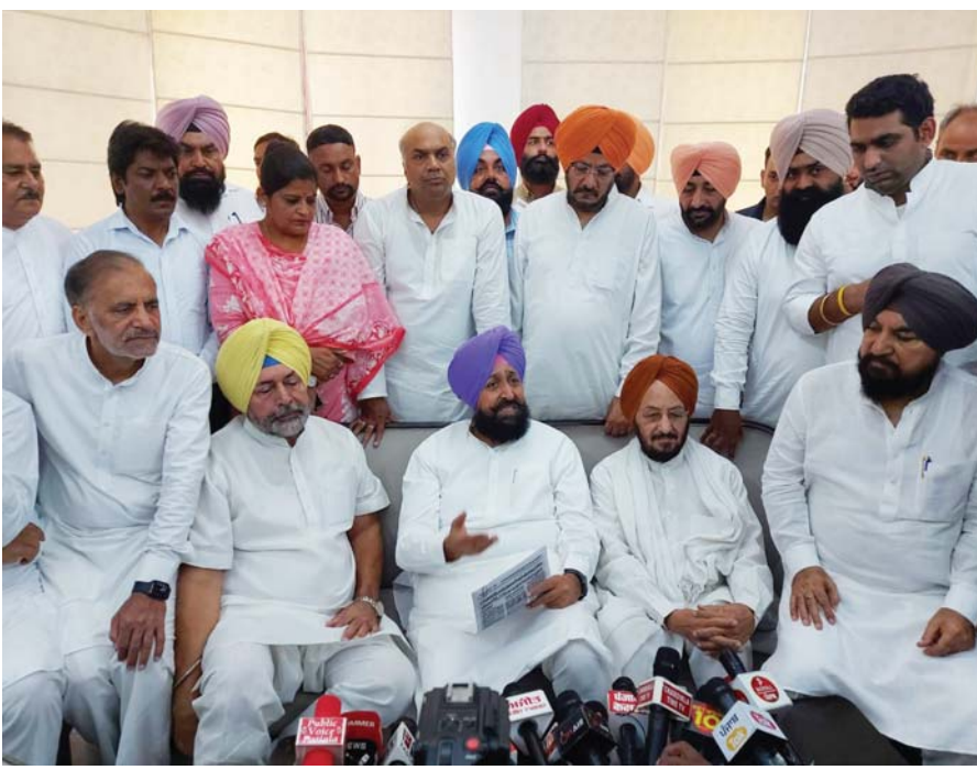
ਵੀ ਮੰਗ ਦਸਣ ਅਤੇ ਪੂਰੀ ਹੋਏ ਹਨ, ਕਿਉਂਕੇ ਕਿਸਾਨਾਂ ਬੰਦ ਪਏ ਲਾਂਘੇ ਨੂੰ ਮੁੜ ਕਰਵਾਉਣ 'ਚ ਨਾਕਾਮ ਸਾਬਤ ਸਮੇਤ ਸ੍ਰੀ ਕਰਤਾਰਪੁਰ ਸਾਹਿਬ ਦੇ ਖੁੱਲ੍ਹਾਉਣ ਲਈ ਕੋਈ ਮੰਗ ਨਹੀਂ

ਪਟਿਆਲਾ (ਪੰਜਾਬੀ ਅਖਬਾਰ ਬਿਊਰੋ) : ਪੰਜਾਬ ਵਿਧਾਨ ਸਭਾ ਵਿਰੋਧੀ ਧਿਰ ਦੇ ਨੇਤਾ ਅਤੇ ਸੀਨੀਅਰ ਕਾਂਗਰਸੀ ਆਗੂ ਪ੍ਰਤਾਪ ਸਿੰਘ ਬਾਜਵਾ ਨੇ ਕਿਹਾ ਕਿ ਸਾਬਕਾ ਮੁੱਖ ਮੰਤਰੀ ਕੈਪਟਨ ਅਮਰਿੰਦਰ ਸਿੰਘ ਖਿਲਾਫ ਕਾਰਵਾਈ ਕਰਨ ਤੋਂ ਆਪ ਸਰਕਾਰ ਡਰ ਰਹੀ ਹੈ। ਉਨ੍ਹਾਂ ਕਿਹਾ ਕਿ ਜੇਕਰ ਕੈਪਟਨ ਅਮਰਿੰਦਰ ਸਿੰਘ ਦੀਆਂ ਫਾਈਲਾਂ ਖੋਲ੍ਹੀਆਂ ਜਾਣ ਤਾਂ ਸਖਤ ਕਾਰਵਾਈ ਕੀਤੀ ਜਾਵੇ ਤਾਂ ਉਨ੍ਹਾਂ ਕੋਲੋਂ 3400 ਕਰੋੜ ਰੁਪਏ ਨਿਕਲਣਗੇ। ਇਸ ਲਈ ਜ਼ਰੂਰੀ ਹੈ ਕਿ ਆਪਣਾ ਡਰ ਦੂਰ ਕਰਕੇ ਕੈਪਟਨ ਖਿਲਾਫ ਕਾਰਵਾਈ ਆਰੰਭੀ ਜਾਵੇ। ਪ੍ਰਤਾਪ ਸਿੰਘ ਬਾਜਵਾ ਨੇ ਕਿਹਾ ਕਿ ਸੱਤਾ ਧਿਰ ਨੂੰ ਕਟਹਿਰੇ ਵਿੱਚ ਖੜ੍ਹਾ ਕੀਤਾ ਉਥੇ ਹੀ ਸਾਬਕਾ ਮੁੱਖ