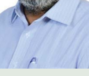
ਮੰਤਰੀ ਵੱਲੋਂ 29 ਅਗਸਤ ਨੂੰ ਮੌਜੂਰ ਧਿਆਨ ਚੰਦ ਦੇ ਜਨਮ ਦਿਨ (ਕੌਮੀ ਖੇਡ ਦਿਵਸ) ਮੌਕੇ ਜਲੰਧਰ ਵਿਖੇ 'ਖੇਡਾਂ ਵਤਨ ਪੰਜਾਬ ਦੀਆਂ' ਦੀ ਸ਼ੁਰੂਆਤ ਕੀਤੀ ਜਾਵੇਗੀ।

ਦਿੱਤੀ ਹੈ। ਸ. ਚੀਮਾ ਨੇ ਕਿਹਾ ਕਿ ਇਸ ਤੋਂ ਇਲਾਵਾ ਵਿੱਤ ਵਿਭਾਗ ਨੇ ਖੇਡਾਂ ਅਤੇ ਯੁਵਕ ਮੰਤਰੀ ਹਰਪਾਲ ਸਿੰਘ ਚੀਮਾ ਨੇ ਦੱਸਿਆ ਕਿ ਵਿੱਤ ਵਿਭਾਗ ਨੇ ਮੁੱਖ ਮੰਤਰੀ ਭਗਵੰਤ ਮਾਨ ਦੇ ਦਿਸ਼ਾ-ਨਿਰਦੇਸ਼ਾਂ 'ਤੇ ਖੇਡ ਵਿਭਾਗ ਵੱਲੋਂ ਮਹੀਨੇ ਤੱਕ ਚੱਲਣ ਵਾਲੇ ਖੇਡਾਂ ਦੇ ਮਹਾਂਕੁੰਡ 'ਖੇਡਾਂ ਵਤਨ ਪੰਜਾਬ ਦੀਆਂ' ਲਈ 25 ਕਰੋੜ ਰੁਪਏ ਜਾਰੀ ਕਰਨ ਦੀ ਪ੍ਰਵਾਨਗੀ ਦੇ ਦਿੱਤੀ ਹੈ।